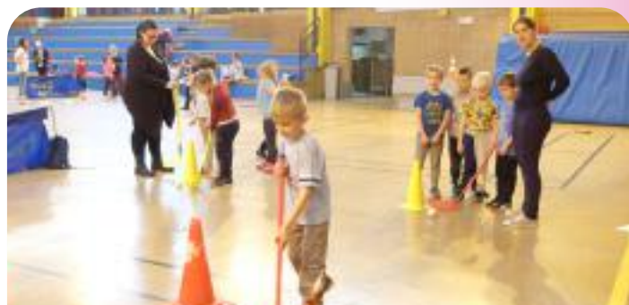
Défis Sportifs du 18 Mai à l'Ecole Municipale de Sports