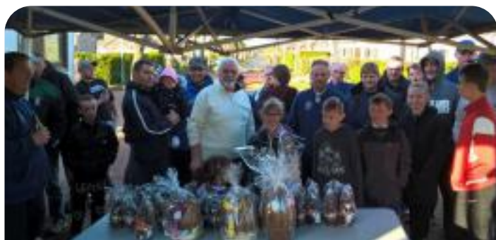
Concours de Pâques de la Pétanque Sainsoise