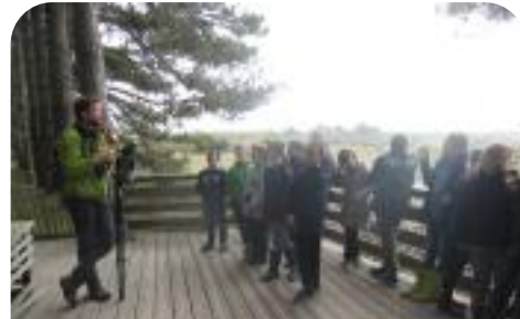
Visite du parc Marquenterre pour les CE2 de l'école Jaurès-Curie