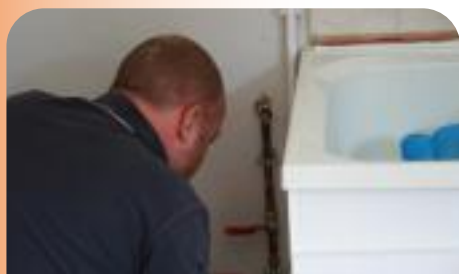
Rénovations 8 rue d'Arles