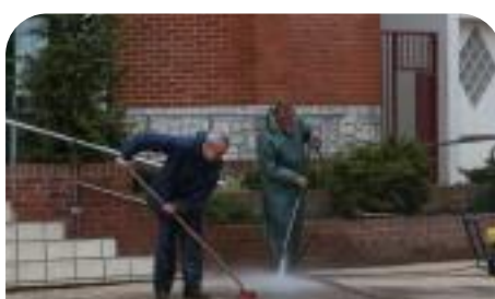
Nettoyage de la place de la mairie