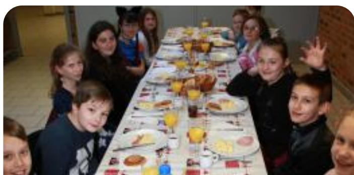
Petit déjeuner anglais pour les primaires