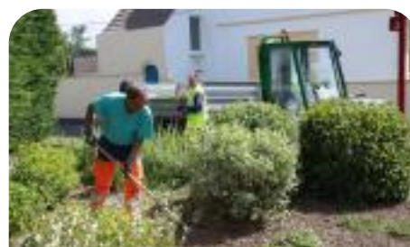
Elagage des arbres et arbustes

Astreinte Services Techniques, en cas d'urgence 06.77.04.54.20