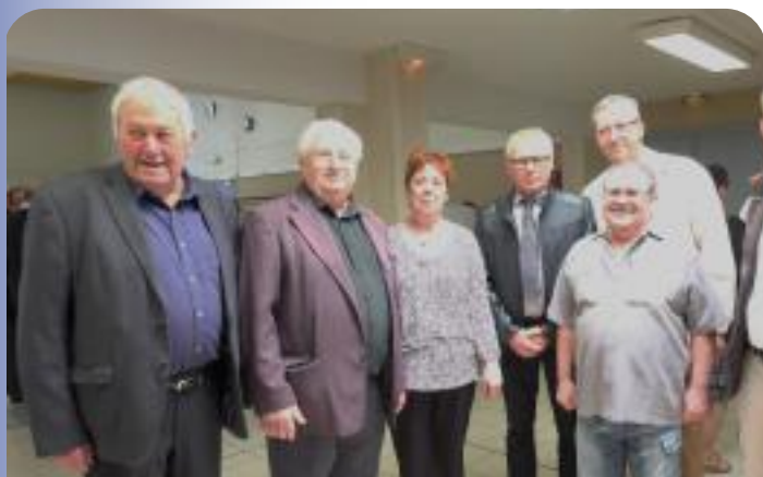
Fêtes des Mères et Pères à la salle des fêtes