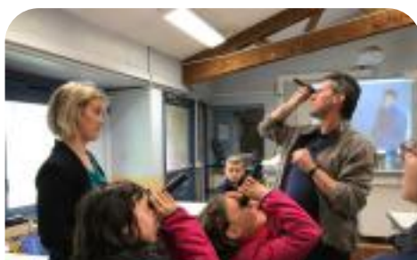
Journée portes ouvertes au collège Jean Rostand