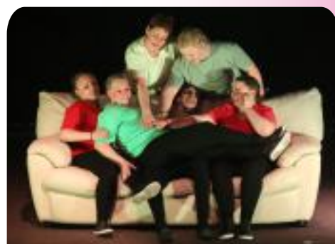
Gala du Twirling Club