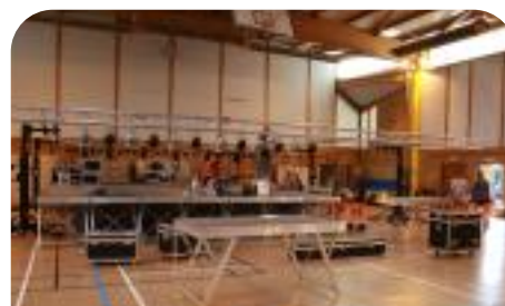
Montages/Démontages des scènes pour les différentes fêtes associatives