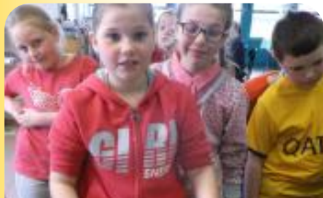
Fabrication de papier pour les CE2 et CM1 de l'école Barbusse