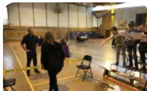
Rassemblement d'une classe de CM2 et de 6ème pour des épreuves manipulatrices