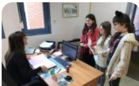
Une chasse au trésor dans le collège pour mieux appréhender la rentrée en 6ème