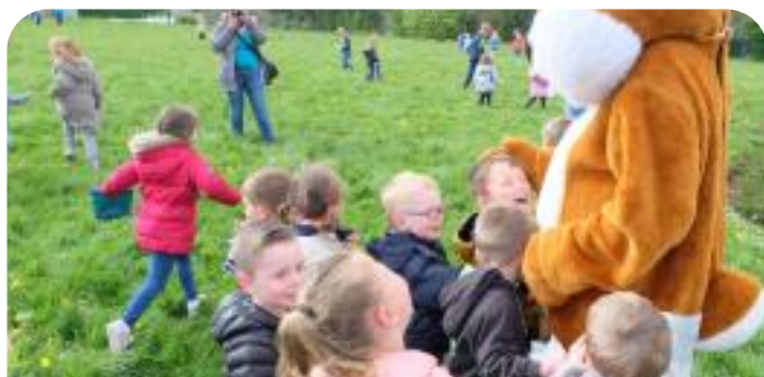
Chasse à l'oeuf de la Municipalité