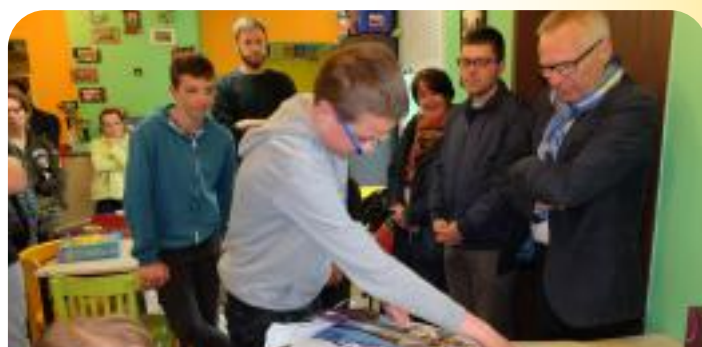
Remise d'une PS4 aux jeunes du Centre Animation Jeunesse