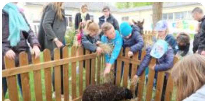
Accueils de Loisirs de Pâques