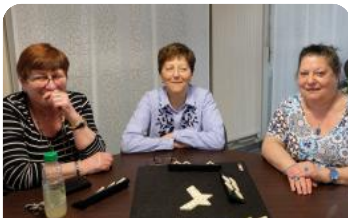
Remise des clés des placards de la salle des Accacias à l'association "Gaité 3"