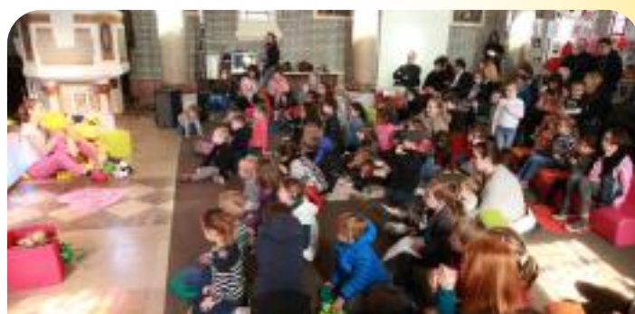
Printemps du Jeune Lecteur