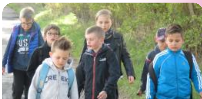
Randonnée à l'Ecole Municipale de Sports