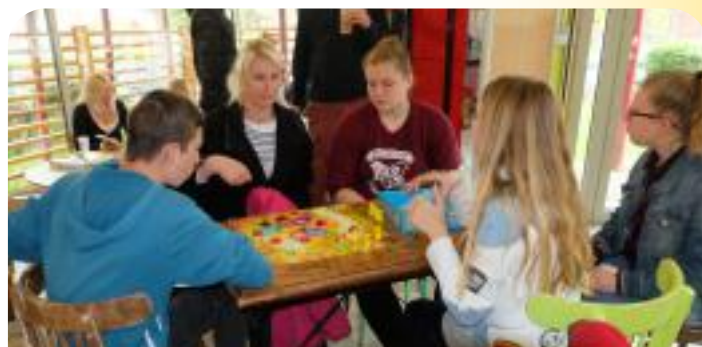
Jeux en famille au Centre Animation Jeunesse