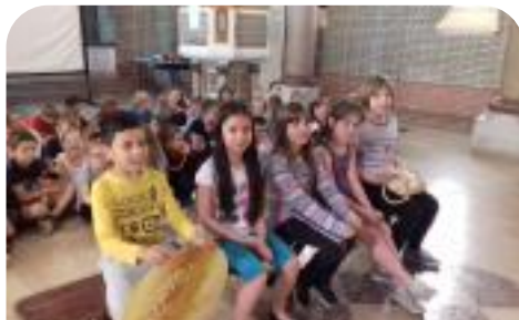
Projet de comédie musicale "Je veux apprendre" par les CE1, CE2 et CM1 de l'école Barbusse