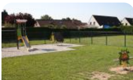
Création d'une aire de jeux résidence Clairefontaine