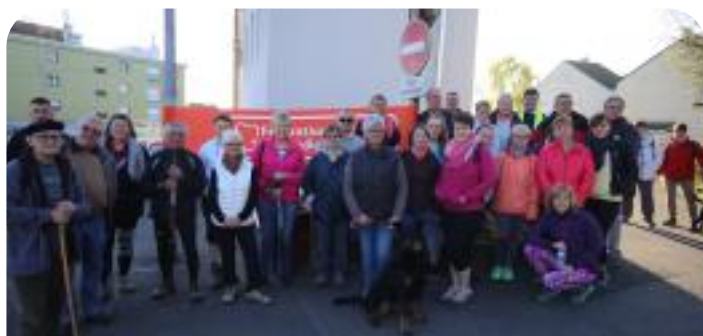
Parcours du Coeur