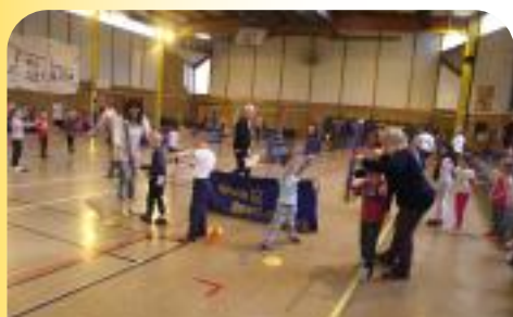
Rencontre Sportive GS/CP entre l'Ecole Curie et la Maternelle La Fontaine