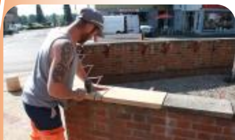
Réparation du muret sur la place de la mairie