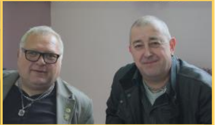
Remise des Médailles du Travail Promotion du 1er Mai