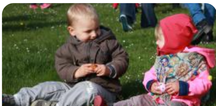
Chasse à l'oeuf de la Ludothèque