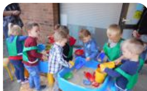
Activités de plein air et accueil des futurs élèves le mercredi matin à Jeannette Prin