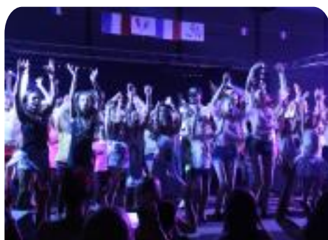
Gala de la Jeunesse Sportive Sainsoise